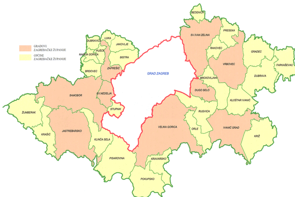
Slika 1: Kartografski prikaz Zagrebačke županije